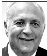
*Associé Senior PCB Litigation

La LRAI vise à remédier à cette situation en permettant aux Etats victimes des détournements de fonds d'un chef d'Etat évincé de bénéficier d'une certaine forme de réparation. A cet effet, elle dégage les autorités suisses de l'obligation qui leur était auparavant imposée de s'appuyer sur le système juridique et judiciaire d'un Etat défaillant. A la place, la loi dispose que les autorités peuvent ordonner le blocage d'avoirs en Suisse si l'Etat d'origine n'est pas en mesure de répondre aux exigences de la procé-