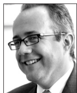
**Associé, PCB Litigation, cabinet d'avocats londonien, spécialiste de la fraude d'entreprise et du recouvrement d'avoirs, www.pcb litigation.com

dure d'entraide en raison du dysfonctionnement de son appareil judiciaire. Les avoirs confisqués sont ensuite utilisés pour améliorer les conditions de vie de la population de l'Etat d'origine ou pour y renforcer l'Etat de droit.